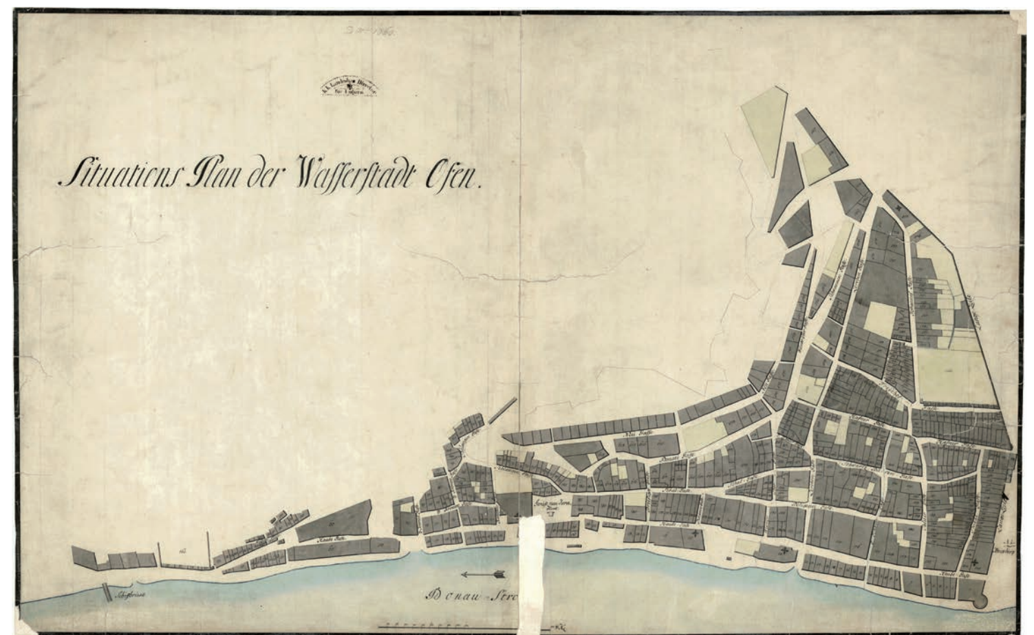
C.1.4 A Víziváros áttekintő térképe, 1786–1792 (BFL XV.16.a.205/62)