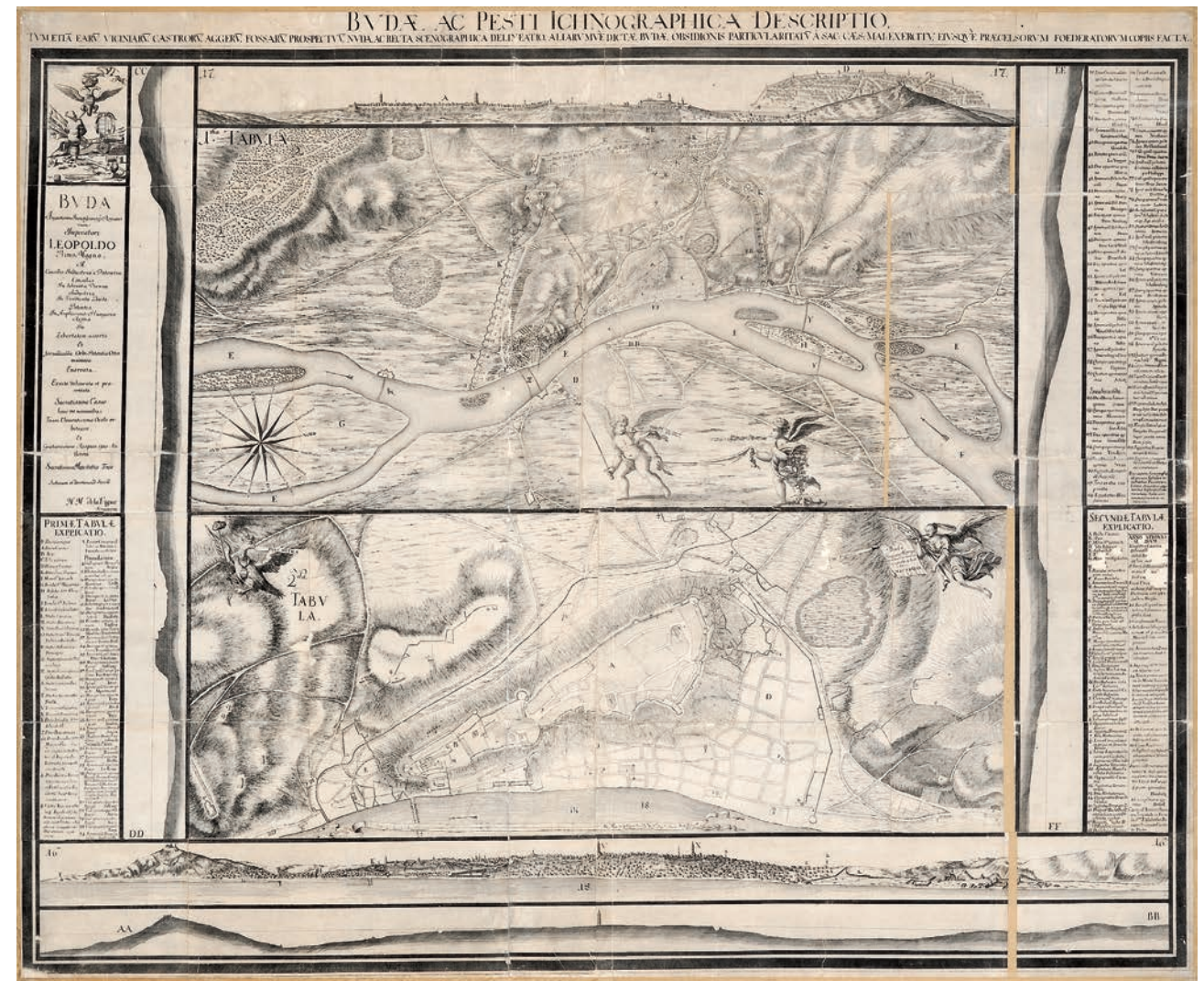
C.1.2 Nicolas Marcel de La Vigne: Budae ac Pesti ichonographica descriptio, 1686, secunda tabula (rézkarc és rézmetszet, BTM Metszettár) C.1.2 Nicolas Marcel de La Vigne: Budae ac Pesti ichonographica descriptio, 1686, secunda tabula (copper engraving, Cabinet of Engravings, Budapest History Museum)