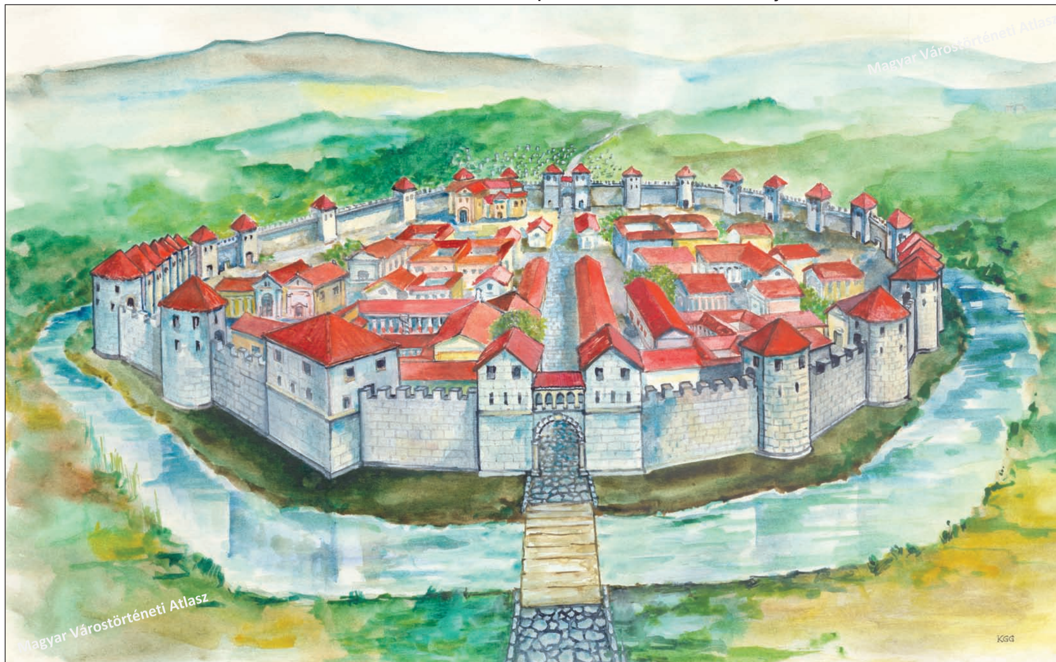
C.1.1 Sopron erődített belvárosa a késő római korban, Kovács-Gombos Gábor rajza Gömöri János kutatásai alapján C.1.1 The fortified centre of Sopron in the Late Roman period, drawing by Gábor Kovács-Gombos, based on János Gömöri's research