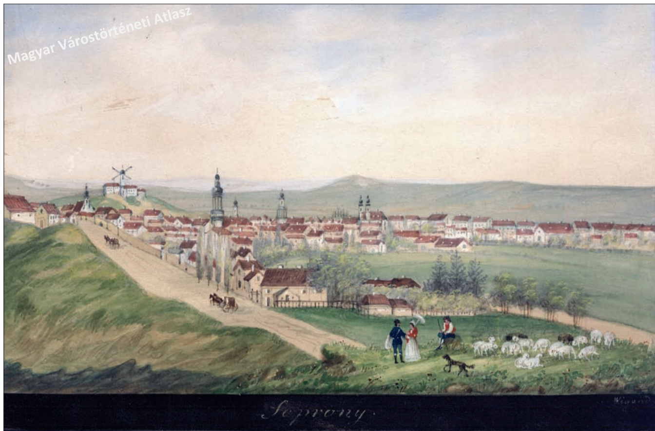
C.5.1 Wigand: Sopron északról, 1840, akvarell, 150 x 205 mm