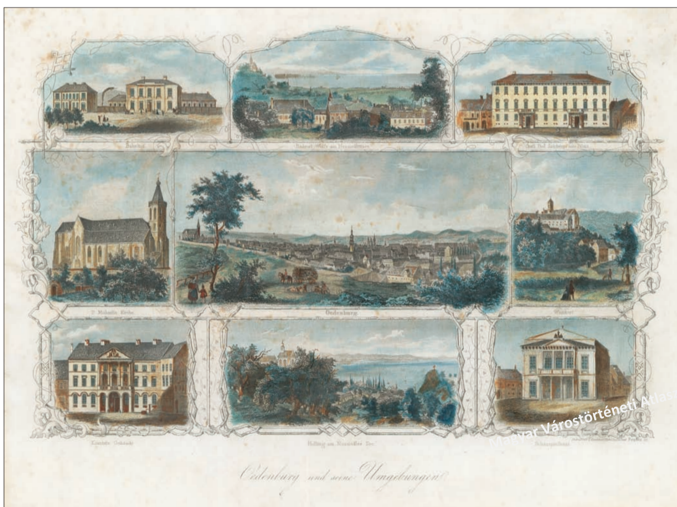
C.5.3 Reschka: Sopron nevezetességei, 1854, színezett rézmetszet, 210 x 280 mm

© Magántulajdon / Private property Lásd Dávid Ferenc kommentárját a kísérőfüzet 60. oldalán / See the comments by Ferenc Dávid on page 60 of the accompanying booklet